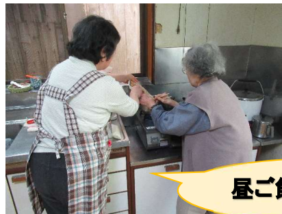
昼ご飯のお手伝い